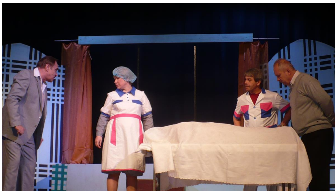
Сцена из спектакля «Обычное дело», 2016 год.