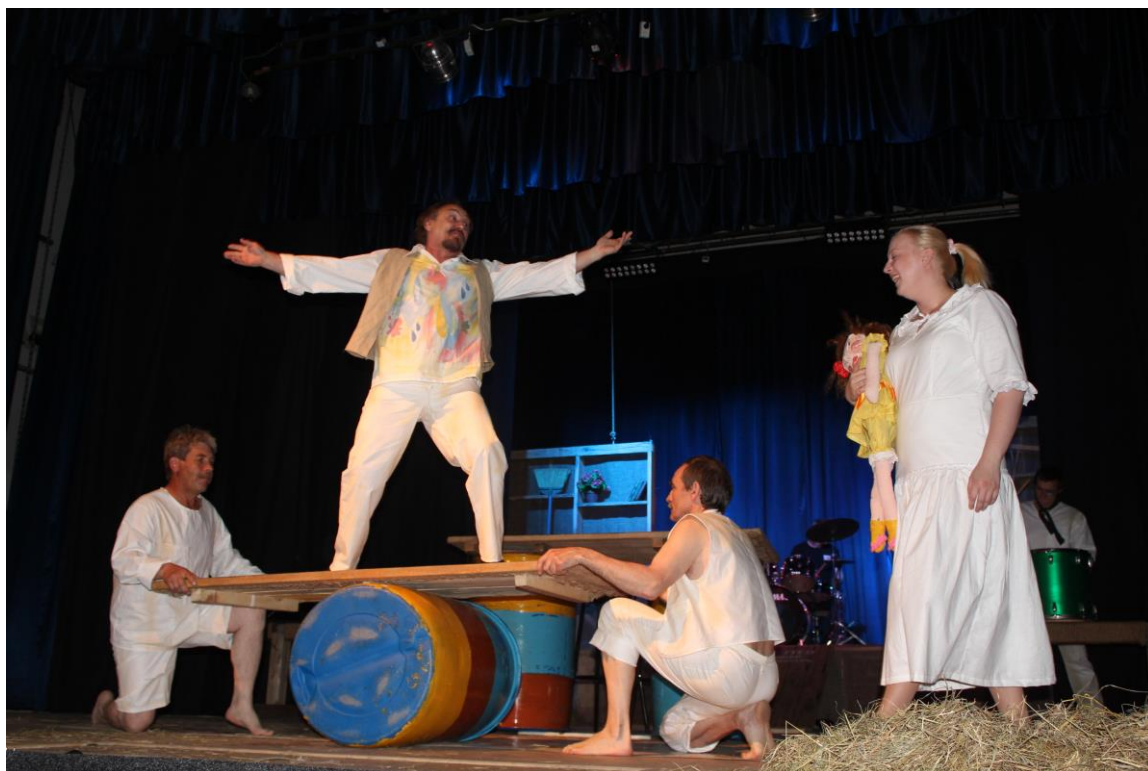
Сцена из спектакля «Продавец дождя», 2016 год.