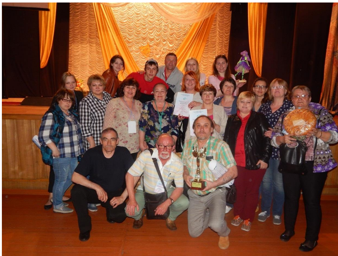
«22 областной фестиваль любительских театров. Калачинск – 2017». Гран –при и восемь лауреатских дипломов.