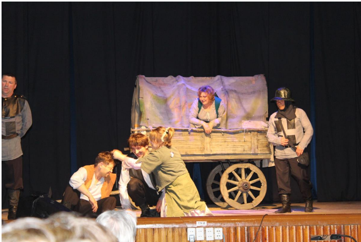
Сцена из спектакля «Мамаша Кураж», 2013 год.