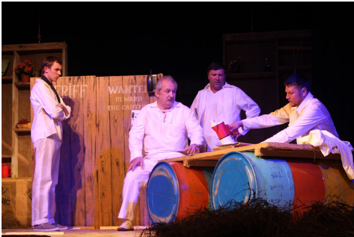
Сцена из спектакля «Продавец дождя», 2016 год.