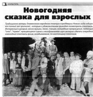
Актрисы Знаменского народного театра

Репертуар театра разнообразен и включает в себя пьесы местных авторов, зарубежных и отечественных классиков. Таких как Булгаков, Чехов,